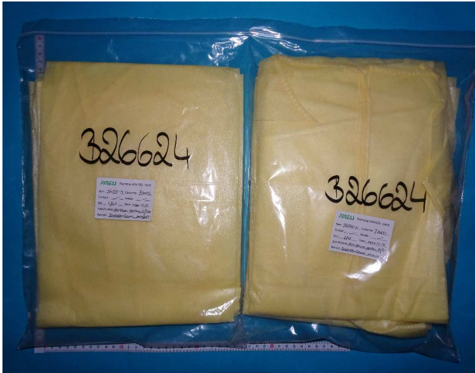
Abb. 1: Isolation Gown